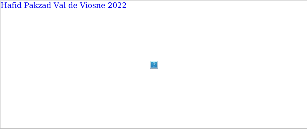
La funambule - L'impressionniste - Le roman de la mer