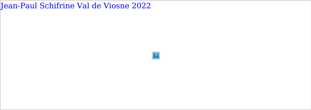
Domaine onirique - Eva (en haut) - Hameau onirique (en bas)