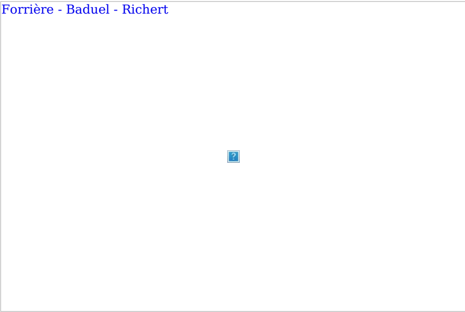
Forrière - Baduel - Richert

Pour Odile Baduel , le livre occupe une place centrale, à la fois source de connaissance et moyen de transcender le quotidien. Elle choisit la reliure à décor pour s’exprimer, avant de se consacrer à la gravure. Chaque estampe devient alors une oeuvre quasi unique reflétant son univers poétique.